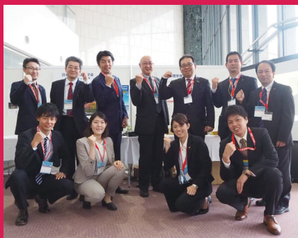
日本理学療法士学会会場にて