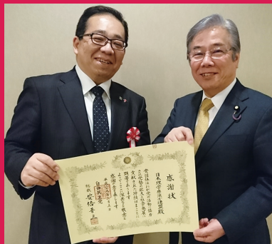
小川克巳参議院議員とともに