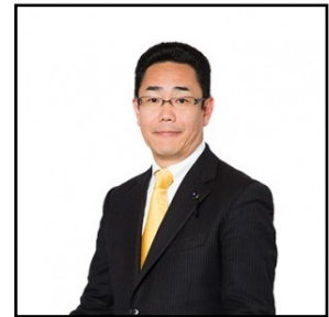
川端 耕一 県議(北九州市門司区)