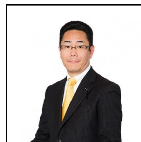
川端耕一県議(北九州市門司区)