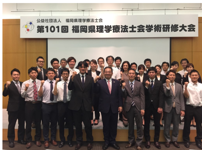
第101回 福岡県理学療法士会学術研修大会にて

2045年に向けて医療費は約1.2倍、介護給付費は2.2倍になることが予測されていますが、社会保障費全体の伸びは抑制され、毎年1万人以上の理学療法士が誕生する現状です。そして、2040年には団体ジュニア世代がすべて高齢者となり、2060までに1600万人が減少する時代を迎えます。病院や施設に入院・入所する人が減り、現状のままではこの業務に従事する理学療法士の雇用が厳しくなることが考えられますし、理学療法士が得る総報酬が減少することも考えられます。