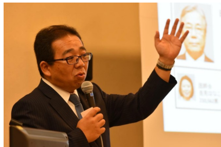
日本理学療法士協会全国研修会にて

福岡県にはこれから幾度も訪問し、皆様と意見交換をさせていただきたいと存じます。今後ともご理解とご支援を賜りますよう心からお願い申し上げます。