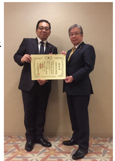
自民党大会にて感謝状を授与